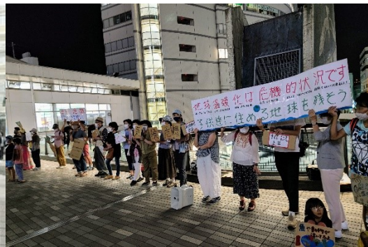
6/10 市役所前で温暖化防止を呼び掛ける市民団体